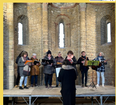
CANTAIRES DE LA VALL D'ÀGER